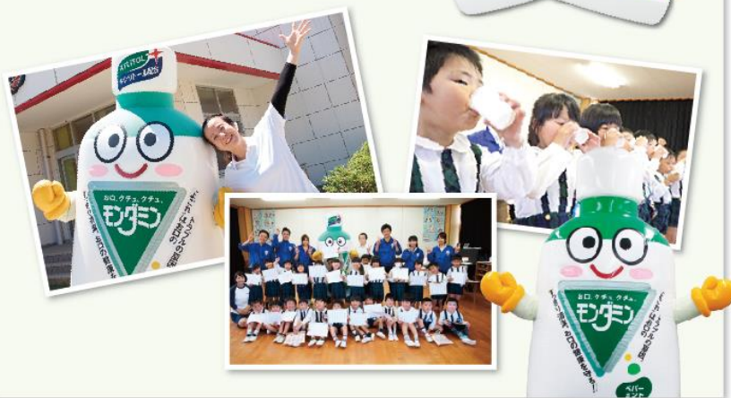
*イベント後、イベント実施園の近隣の園へサンプリングをしました。