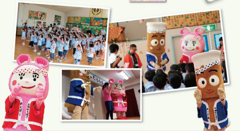
*イベント後、イベント実施園の近隣の園へサンプリングをしました。